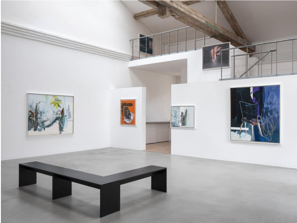
Kunstverein KunstHaus Potsdam 2022, Foto: Bernd Hiepe