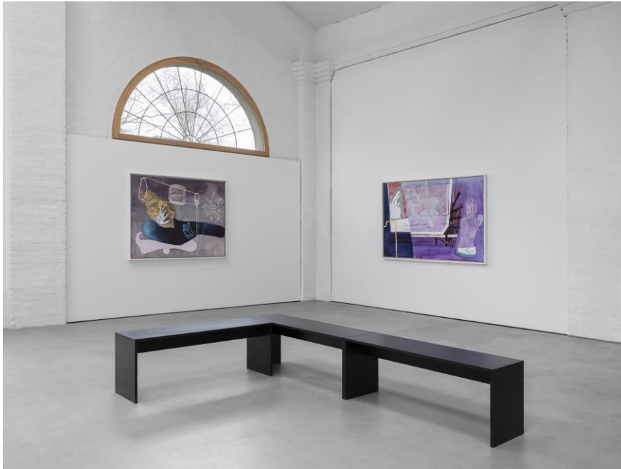
Kunstverein KunstHaus Potsdam 2022, Foto: Bernd Hiepe

oder persönlich montags in der Vorlesungszeit zwischen 11:00 und 18:00 Uhr.